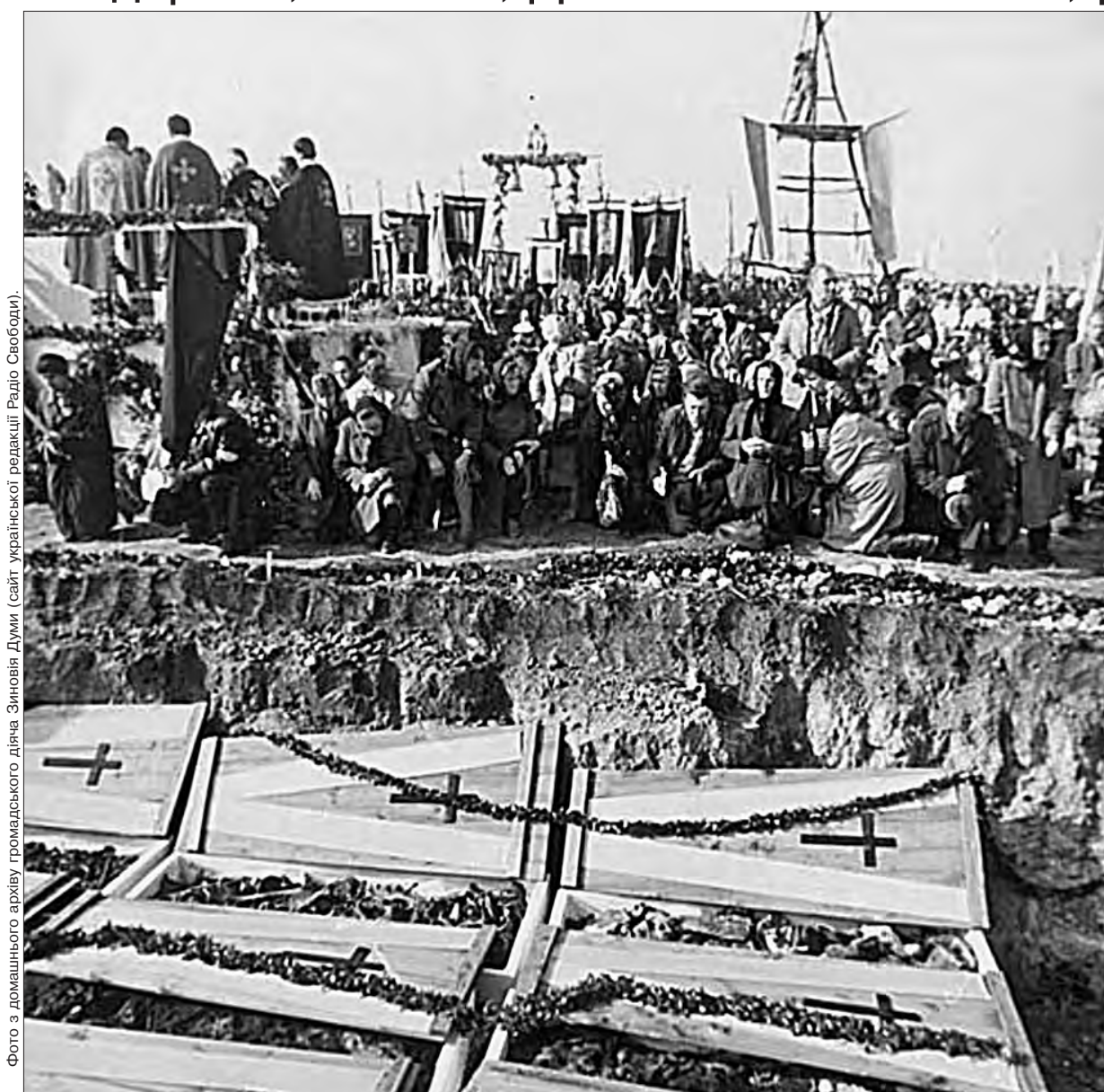
Фото з домашнього архіву громадського діяча Зиновія Думи (сайт української редакції Радіо Свободи).

У карельському урочищі Сандармох уже зима — днями холодний дощ перейшов у дрібний сніг, який замітає ледь примітні розстрільні ями, й дорогу, що веде від краю соснового лісу до восьмитонного кам'яного хреста з вибитими на світло-сірому граніті словами «Убієнним сином України», і прикріплені до дерев фотографії страчених тут енкавеевиками людей. Зі світлим на сирій від моху сосні, що росте поруч з українським меморіалом, ледь усміхаються сповнені сил і творчих задумів Лесь Курбас і Микола Куліш. Під їхніми фотографіями написи: «Курбас Олександр Степанович. 12.09.1887 р. — 03.11.1937 р. Народний артист України, режисер» і «Куліш Микола Гурович. 06.12.1892 р. — 03.11.1937 р. Український драматург». Ось що записано у справі митця світової масштабу, віднайденій в архіві НКВС: «Курбас Олександр Степанович (Лесь Курбас), 1887 р. н., народився в м. Самбір (Галичина), українець, із сім'ї актора, колишній член партії соціал-демократів, закінчив історико-філософський факультет Львівського університету, керівник Молодого театру в 1917–1922 рр. (м. Київ), організатор і керівник театру «Березіль» до 5 жовтня 1933 р., народний артист УСРР, проживав: м. Харків, будинок письменників «Слово», кв. 64. З грудня 1933 р. постановник Малого театру і Єврейського театру в Москві, тимчасово проживав: 3-я Тверська-Ямська вулиця, буд. 12, кв. 5.