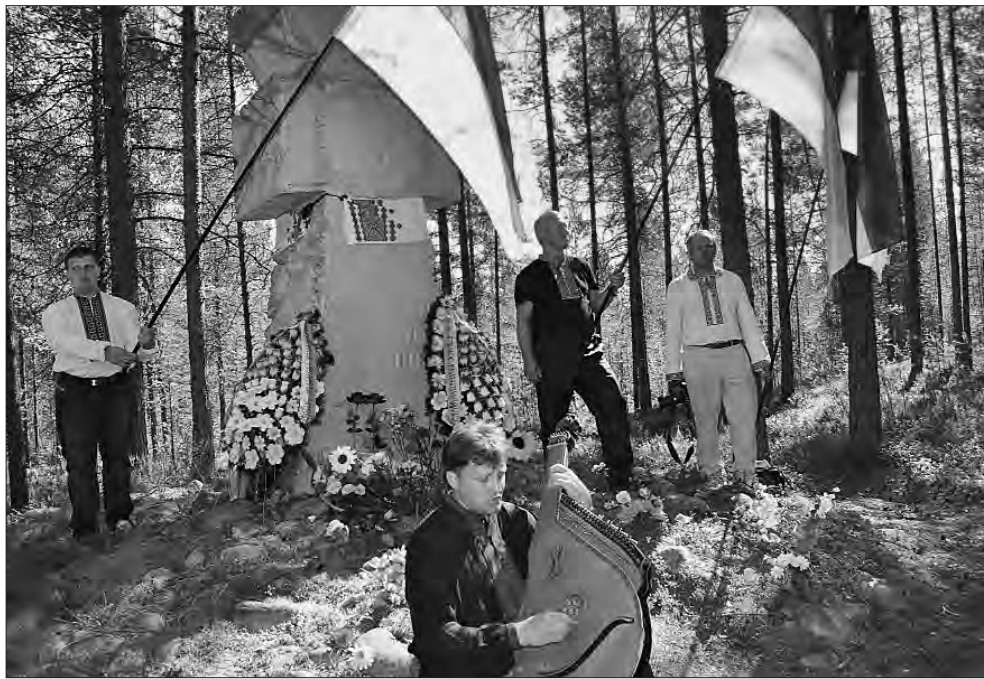
Біля козацького хреста «Убісним синам України» в урочищі Сандармох (Карелія).

був так званий штрафбат, із якого майже ніхто не повертався, загинув в іншому концтаборі — «Севвостлаг» у хабаровському краї.