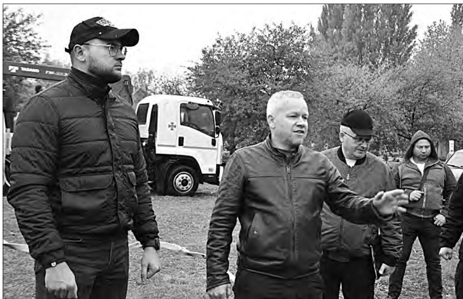
Міський голова Луцька Ігор Поліщук (крайній ліворуч) ознайомився з роботою КП «Луцькводоканал» в умовах припинення централізованого електропостачання.

Участь в актуальному на час війни заході взяли старости старостинських округів, керівники Луцького районного управління ГУ ДСНС у Волинській області, представники департаментів економіки, ЖКГ, освіти, управлін охорони здоров'я, капітального будівництва, відділів з питань надзвичайних ситуацій та цивільного захисту населення, транспорту, АТ «Волингаз», комунальних підприємств «Луцьктепло», «Луцькводоканал», «Луцьке електротехнічне підприємство — Луцьквітло», «Парки та сквери м. Луцька», «Луцькспецкомунтранс», ЖКП.